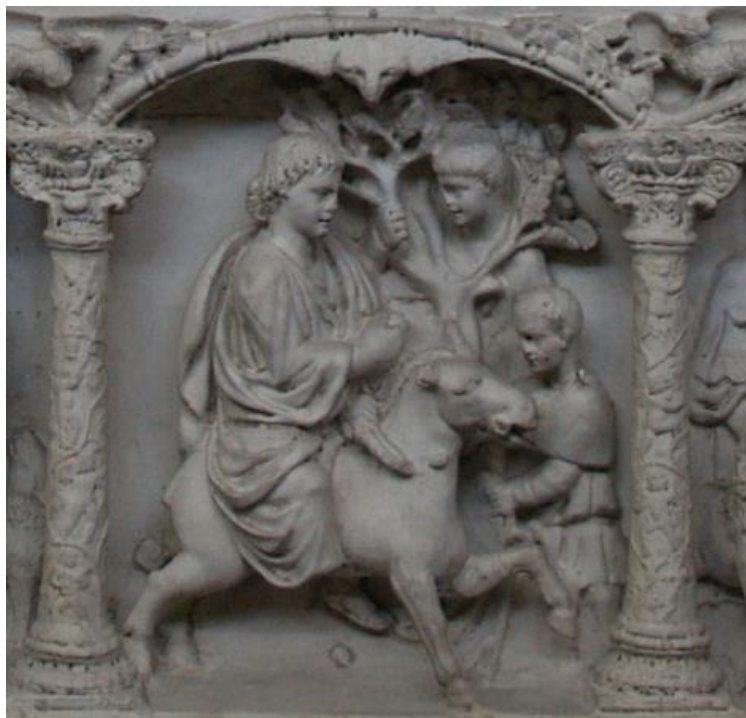
Εικόνα 8 Βαϊοφόρος (λεπτό), Σαρκοφάγος του Junius Bassus, Θησαυρός Βασιλικής Αγίου Πέτρου, 359 μ.Χ.

Πολύ ενδιαφέρουσα είναι η περίπτωση του Ευαγγελίου του Rossano, όπου στη σχετική σελίδα η παράσταση απλώνεται εγκάρσια στο άνω τμήμα, ενώ χαμηλότερα το θέμα πλαισιώθηκε με την αναγραφή σχετικών προφητειών (Εικ. 1).