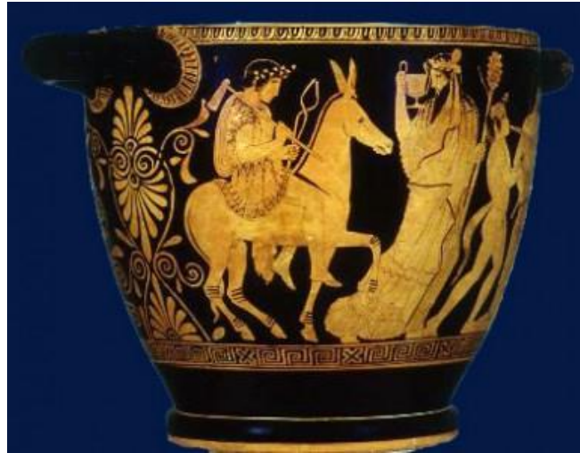
Εικόνα 2 ΟΉφαιστος επί όνου, επιστρέφει στον Όλυμπο με την συμβολή του Διονύσου, ερυθρόμορφη αττική σκύφος, αποδίδεται στον ζωγράφο του Κλεοφώντος, 430-420 π.Χ., Toledo Museum of Art

δημιουργίας 19 . Παράλληλα ήταν και χωλός 20 , με τον Δημιουργό Χριστό να δέχεται, προφητικά, το πλήγμα στην πτέρνα 21 . Εξαιρετικές διαλεκτικές προς τον Χριστό, των οποίων η ανάπτυξη δεν είναι της παρούσης.