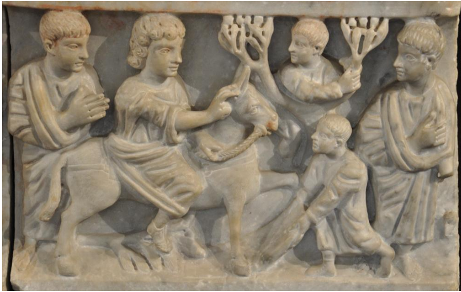
Εικόνα 7 Βαϊοφόρος, Σαρκοφάγος Adelfritha, Κατακόμβες Ιωάννου, Συρακούσες, 325-350 μ.Χ.

Αγένειο ανιχνεύουμε τον Χριστό και σε άλλες ανάγλυφες παραστάσεις, όπως σε σαρκοφάγους του Βατικανού, των Συρακουσών (Εικ. 7), αλλά και αυτή του Junius Bassus (Εικ. 8), παράλληλα με το στοιχείο του στρωσίματος των ενδυμάτων.