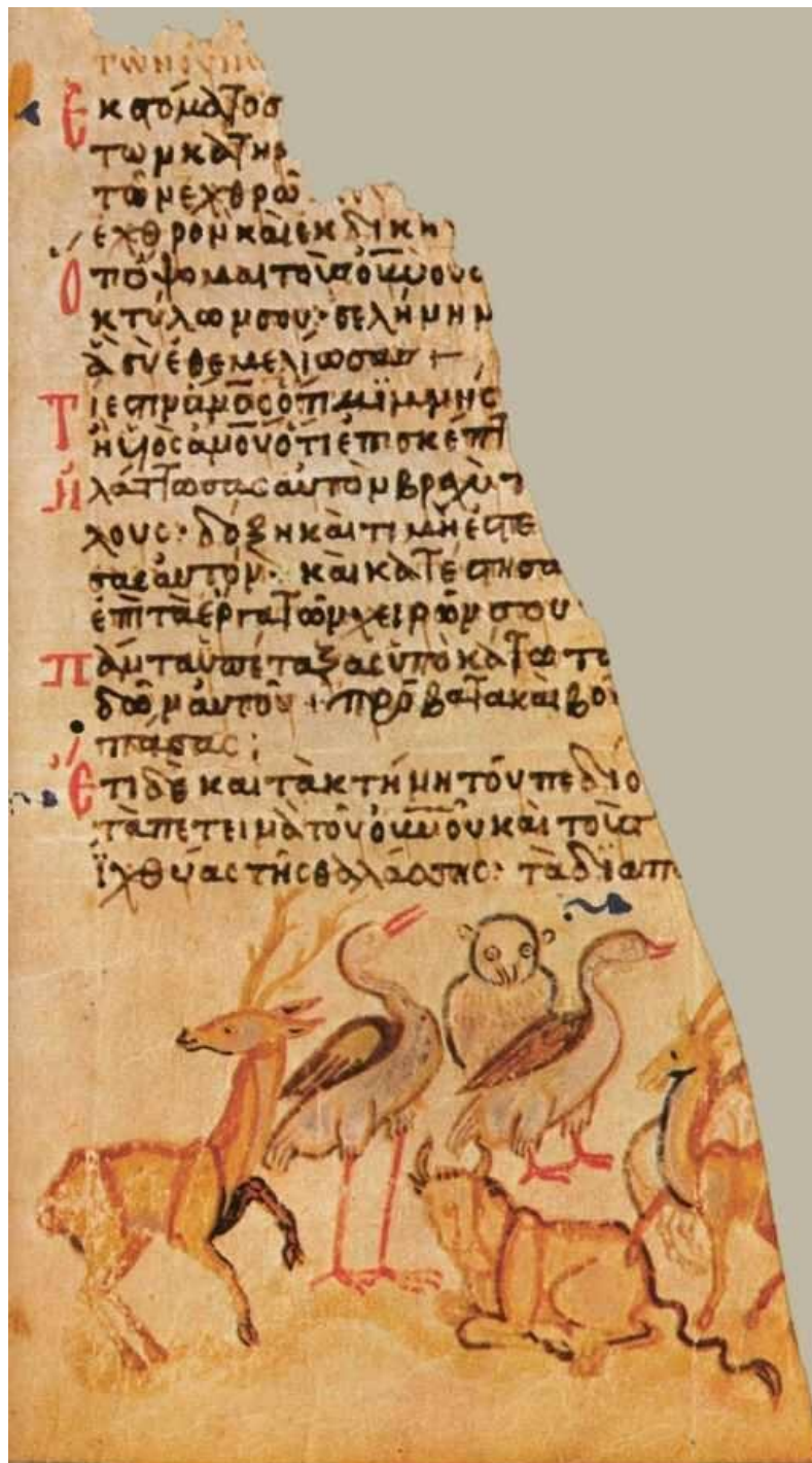
Εικόνα 11 «έκ στόματος νηπίων και θηλαζόντων κατηρτίσω αἶνον ἔνεκα τῶν ἐχθρῶν σου τοῦ καταλῦσαι ἐχθρὸν καὶ ἐκδικητὴν...πάντα ὑπέταξας ὑποκάτω τῶν ποδῶν αὐτοῦ, πρόβατα, καὶ βόας ἀπάσας, ἔτι δὲ καὶ τὰ κτήνη τοῦ πεδίου, τὰ πετεινὰ τοῦ οὐρανοῦ καὶ τοὺς ἰχθύας τῆς θαλάσσης, τὰ διαπορευόμενα τρίβους θαλασσῶν», Ψαλμός 8,3 & 7-9, Ψαλτήρας Chludon, 850-875 μ.Χ.