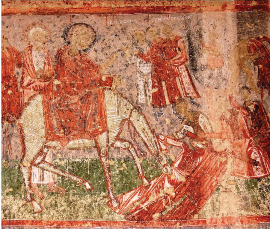
Εικόνα 9 Βαϊοφόρος, τοιχογραφία, Εκκλησία Ταξιάρχη / Νικηφόρου Φωκά, Καππαδοκία. 964-965 μ.Χ.