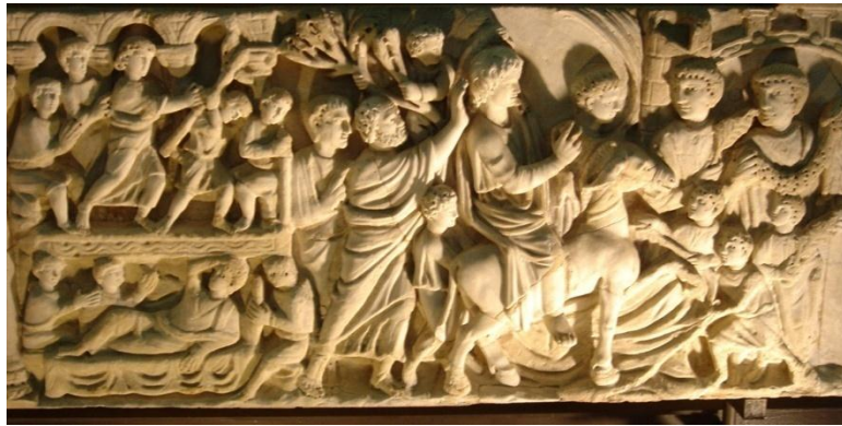
Εικόνα 5 Βαϊοφόρος, Σαρκοφάγος της Βηθεσδά, Μουσείο Βατικανού, τέλη 3ου - αρχές 4ου αιώνα π.Χ.

Ανάλογα πρώιμη είναι και η εμφάνιση του θέματος. Το θέμα φιλοτεχνούνταν πιθανότατα από τον 3 ο αιώνα και αναμφίβολα τον 4 ο αιώνα. Ένα τέτοιο παράδειγμα εμφανίζεται σε σαρκοφάγο, η οποία σήμερα ανήκει στο Μουσείο του Βατικανού. Ο Χριστός, νέος και αγένειος, ο οποίος μάλλον προσλαμβάνει εικαστικά χαρακτηριστικά του θεοποιημένου Αλεξάνδρου, εισέρχεται θριαμβευτής επί της όνου (Εικ. 5). Ήδη σε αυτήν την παράσταση, έχουμε διαμορφωμένα τα βασικά και γνωστά έως σήμερα συνανήκοντα στοιχεία 37 .