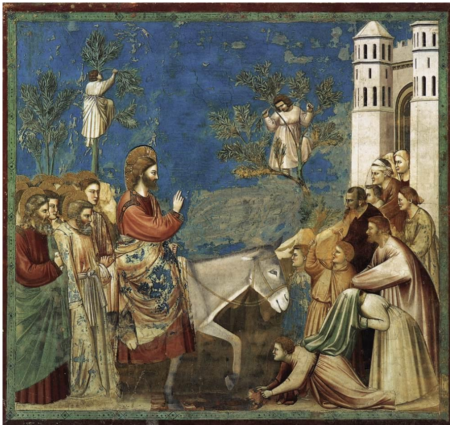
Εικόνα 10 Giotto di Bondone, Η Είσοδος στα Ιεροσόλυμα, τοιχογραφία, Veneto Padua Scrovegni Cappella, 1303-5 μ.Χ.