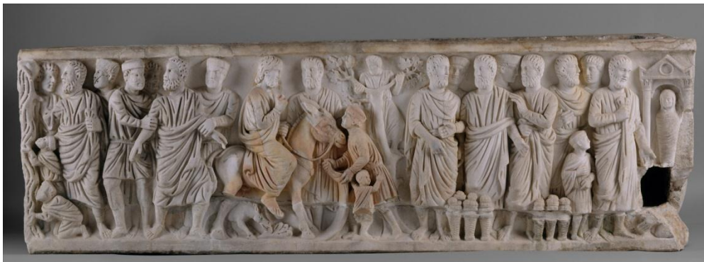
Εικόνα 6 Βαϊοφόρος (λεπτ.). Σαρκοφάγος, Μητροπολιτικό Μουσείο Νέας Υόρκης, ~312 μ.Χ.

Σε μια άλλη περίπτωση, αυτή μιας σαρκοφάγου του Μητροπολιτικού Μουσείου της Νέας Υόρκης, ανιχνεύουμε πιο έντονα την παρουσία των παιδών και νηπίων, τα οποία εις πείσμα των απίστων αινούν τον γενειοφόρο Χριστό (Εικ. 6) 38 .