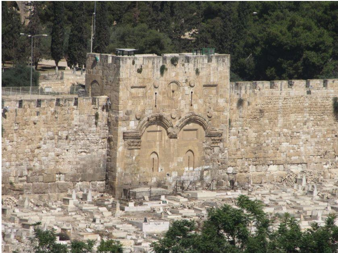
Εικόνα 3 Η Χρυσή ή Ανατολική Πύλη, Ιεροσόλυμα

Η είσοδος στα Ιεροσόλυμα, γινόταν από διάφορες και ονομαστές πύλες. Οι ευαγγελιστές δεν παραδίδουν το όνομα της, ωστόσο η σχετική παράδοση θεωρούσε πάντα την ανατολική Χρυσή Πύλη, ως αυτήν δια της οποίας ο Ιησούς εισήλθε στην ιερά πόλη.